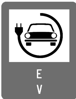
Figura 1*): Panou de informare

p) stațiile de reîncărcare instalate prin Program vor fi semnalizate corespunzător cu următorul panou de informare care va fi menținut și întreținut în bună stare pe toată durata de implementare și monitorizare a proiectului: