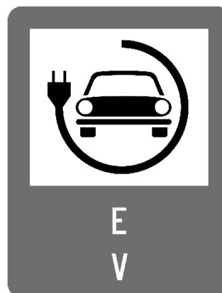
Figura 1*): Panou de informare

18. stațiile de reîncărcare instalate prin Program vor fi semnalizate în concordanță cu standardele europene și naționale în domeniu, potrivit panoului prezentat cu titlu de exemplu: